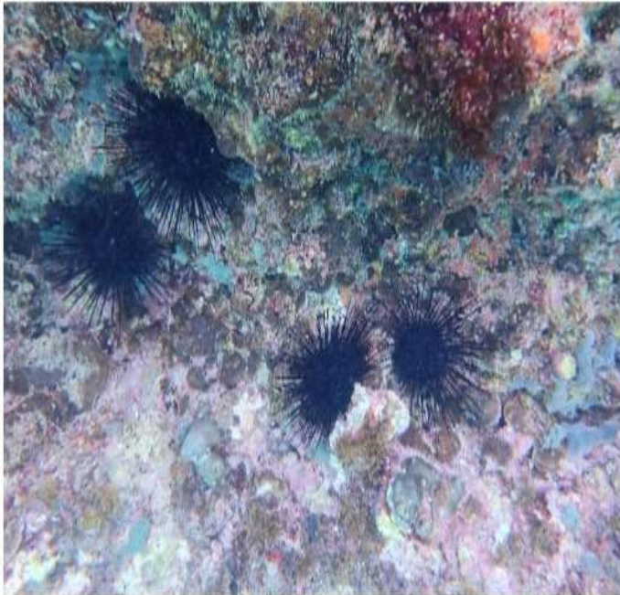
1. individualnan saludabel pega na e superficie duro di piedra

Tambe pa evita cu e malesa ta sigui plama, sambuyadonan mester percura pa haci nan wetsuits y ekipo di sambuya bon limpi cu awa dushi despues di cada sambuya y evita sambuya den un sitio unda tin indicacion di malesa ("sitio contamina") pa un "sitio limpi". Pa ultimo, mester evita pa mishi of move bushinan bibo, morto of muriendo.